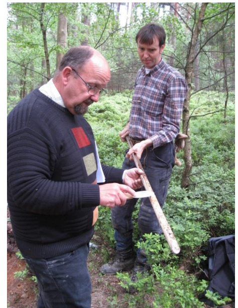
Beurteilung der Bodeneigenschaften durch den Geologischen Dienst NRW

Die Arbeiten sind Teil der forstlichen Standortkartierung, die vom Landesforstgesetz für sämtliche Wälder des Landes vorgeschrieben ist und seit vielen Jahren in Nordrhein-Westfalen durchgeführt wird.