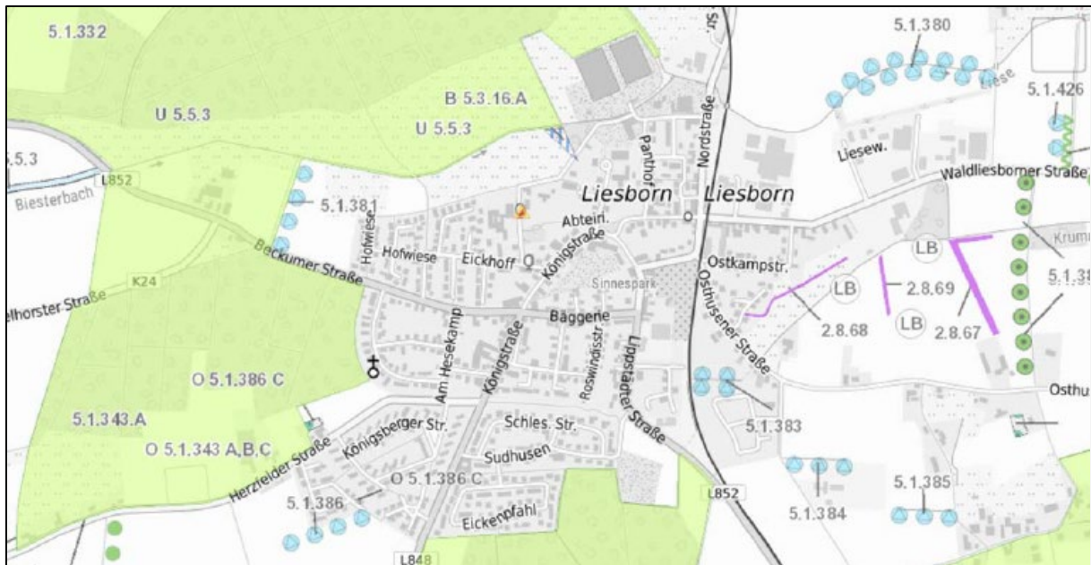
Abbildung 3: Landschaftsplan „Wadersloh“ des Kreises Warendorf – Ausschnitt ohne Maßstab