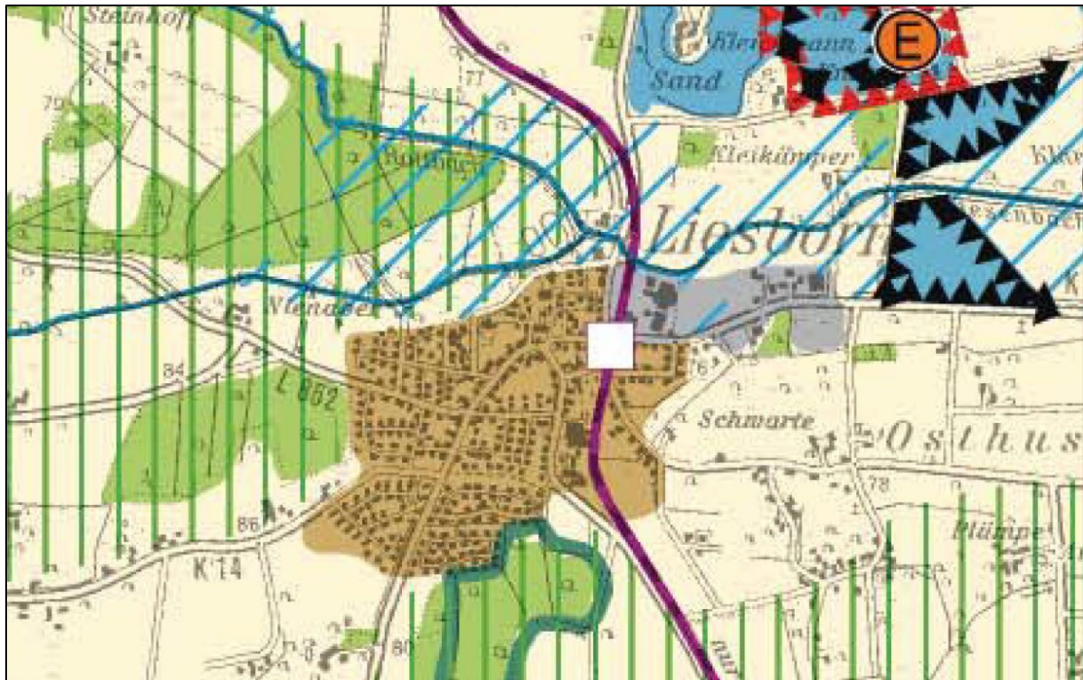
Abbildung 1: Regionalplan Münsterland, Auszug ohne Maßstab

Im Regionalplan Regierungsbezirk Münster, Teilabschnitt Münsterland, liegt der Geltungsbereich der Bebauungsplanänderung im allgemeinen Siedlungsbereich. Die Planung entspricht somit den im Regionalplan dargestellten Zielen der Raumordnung und erfüllt die Anforderungen des Anpassungsgebotes nach § 1 (4) BauGB.