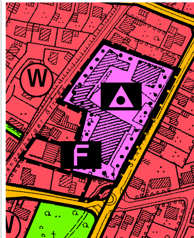
Darstellung gem. § 5 (2) BauGB